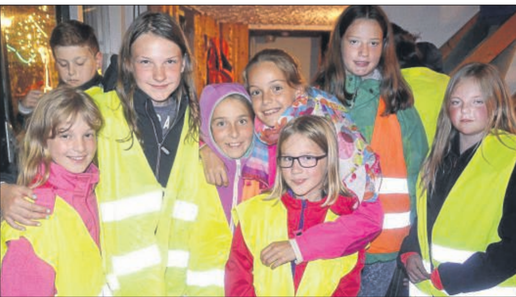
Gut sichtbar: Die Ferienzeit-Teilnehmer mit Warnwesten.